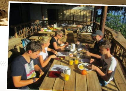
Frühstück in der Regenwaldlodge