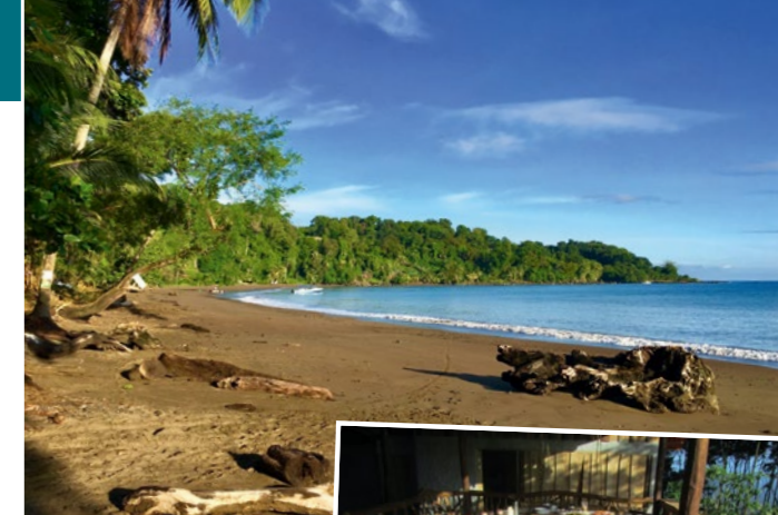
Karibikstrand zum Abschluss der Reise