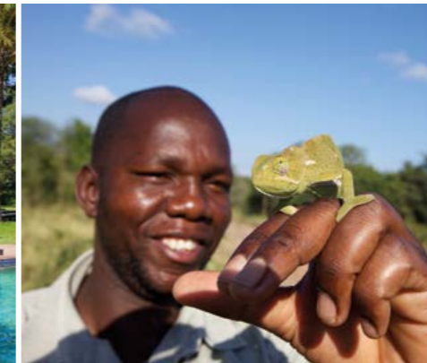
Tolle Guides zeigen auch die kleinsten Tiere