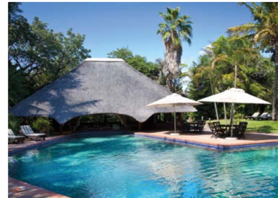
Sorgfältig ausgewählte hochwertige Lodges