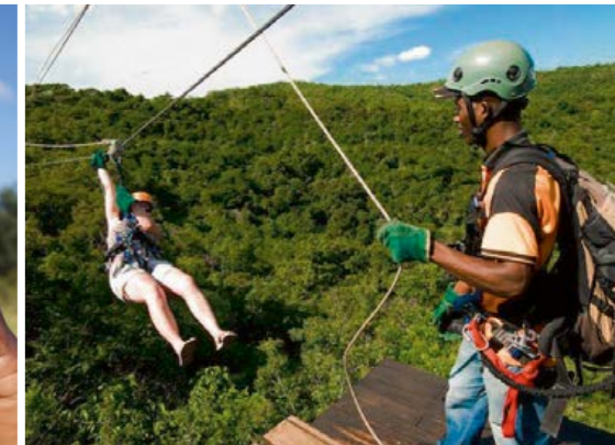
Action beim Zipline im Königreich der Swasi