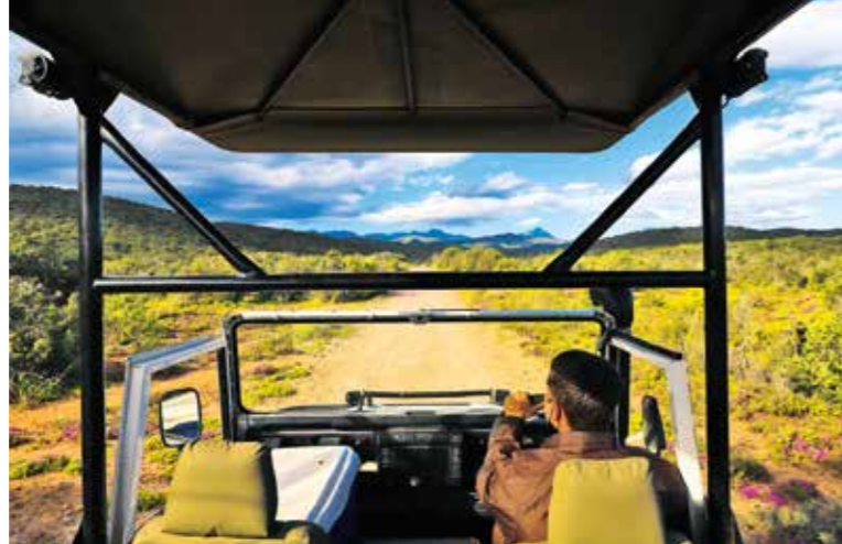
Faszination Funkgerät: auf Pirschfahrt in der Buffelsdrift Game Lodge.

Das zeigt sich an vielen kleinen Dingen: Die Geländer der Balkone sind absturzsicher, der Poolbereich ist umzäunt. Abends stehen der Hochstuhl, die Malsachen und das Kiddies Menu bereit, wenn wir zum frühen Dinner erscheinen. Und beim Game Drive darf Nelion auch mal