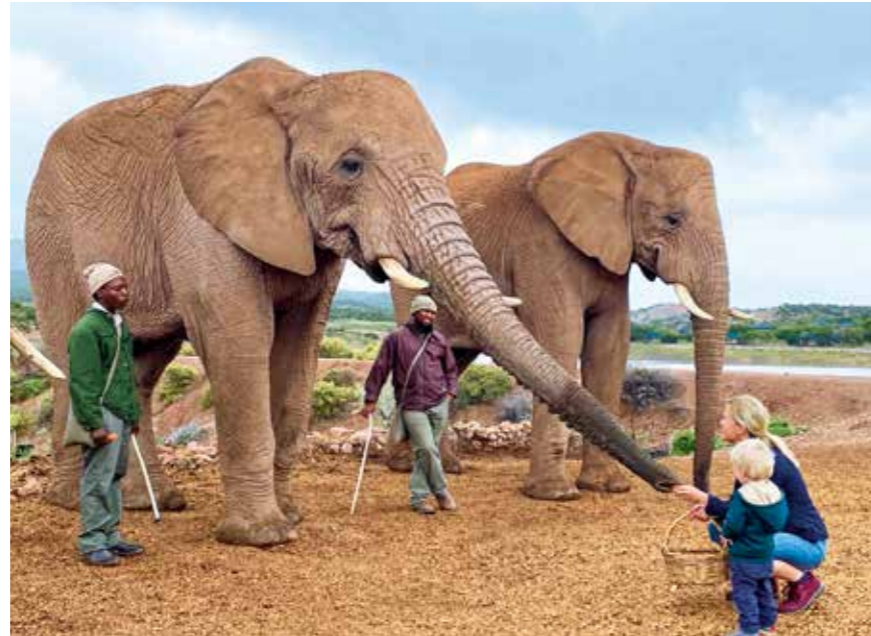
Zwei Pfleger koordinieren die Begegnung mit den Elefanten.

ren während der Dürre ein Lebensretter für die Tiere.“ Catherine zeigt auf einen unscheinbaren Busch. Der