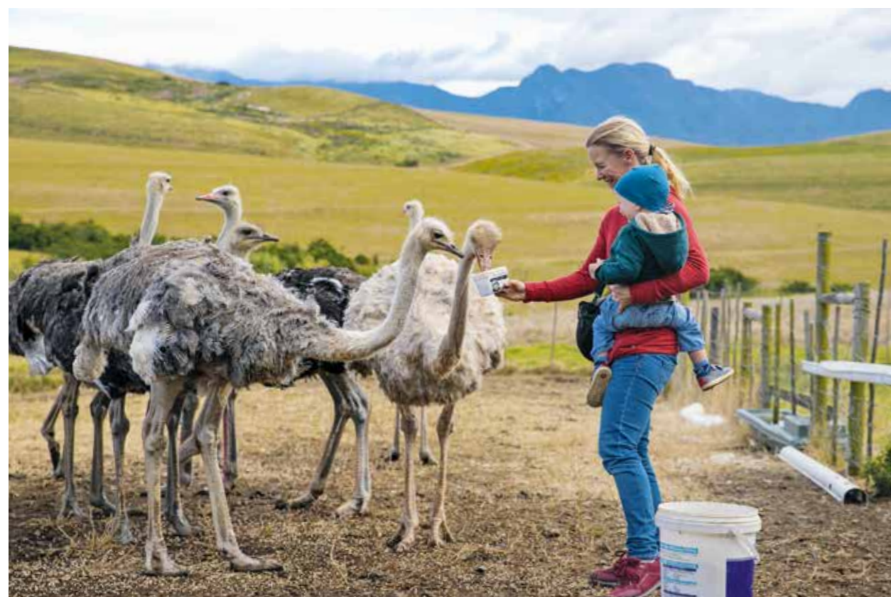
Vorsicht Schnabelattacker: Bei einer Farmtour auf der Skeiding Guest Farm darf man helfen, die Strauße zu füttern.