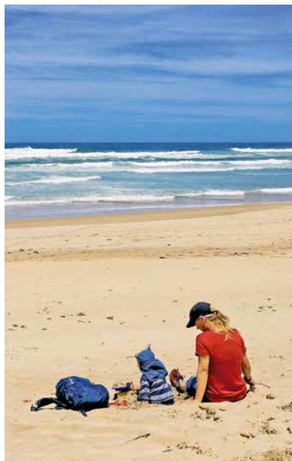
Beschauliche Ruhe am weiten Brenton Beach bei Knysna (oben). Frisch gefangene Austern aus der Lagune (rechts).