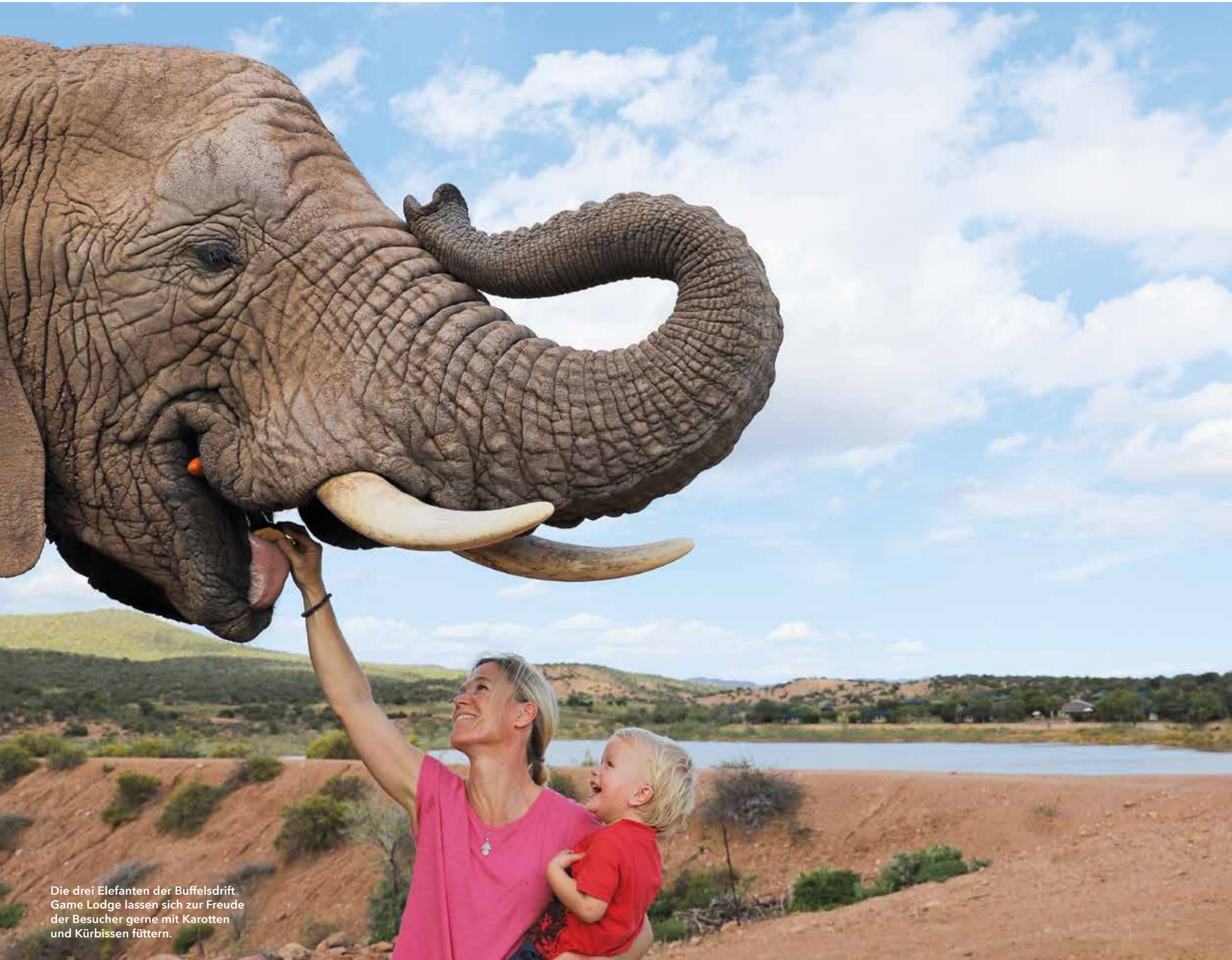
Die drei Elefanten der Buffelsdrift Game Lodge lassen sich zur Freude der Besucher gerne mit Karotten und Kürbissen füttern.

Mit Kleinkind allein durch Südafrika reisen – geht das überhaupt? Bei guter Routenplanung und Unterkunftswahl ist eine Reise auf der Garden Route zwischen Kapstadt und Port Elizabeth ein unvergessliches Erlebnis für Groß und Klein – fand Astrid Därr (Text und Fotos), die es mit ihrem zwei-jährigen Sohn ausprobierte, trotz Pandemie.