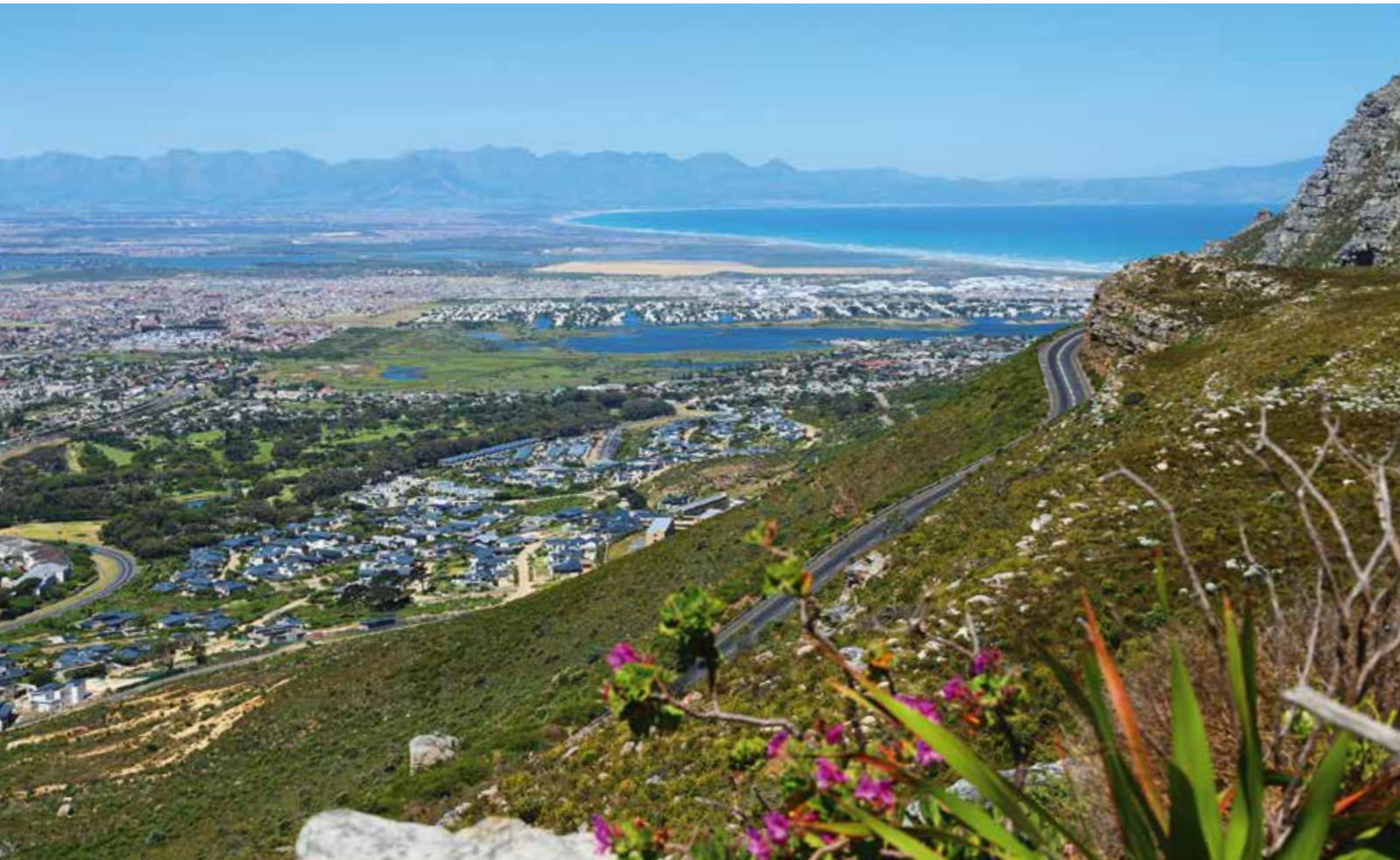
Auf der Rückfahrt von Simon's Town über die M 64 durch das Silvermine Nature Reserve eröffnen sich tolle Blicke auf Kapstadt.

www.intaba.de info@intaba.de +49 (0)7034 643577