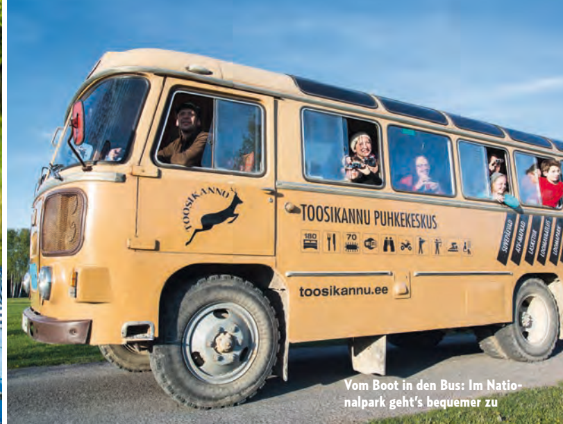
Vom Boot in den Bus: Im Natio- nalpark geht's bequemer zu

bis zu fünf Junge. So reguliert sich die Größe des Rudels auf eine sehr natürliche Weise.