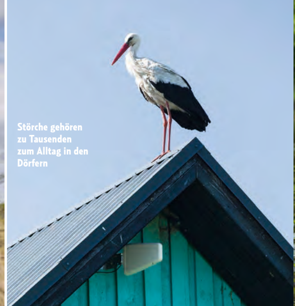
Störche gehören zu Tausenden zum Alltag in den Dörfern

tenlang nach Nahrung. Das war ein mehr als gelungener Auftakt unserer Reise.