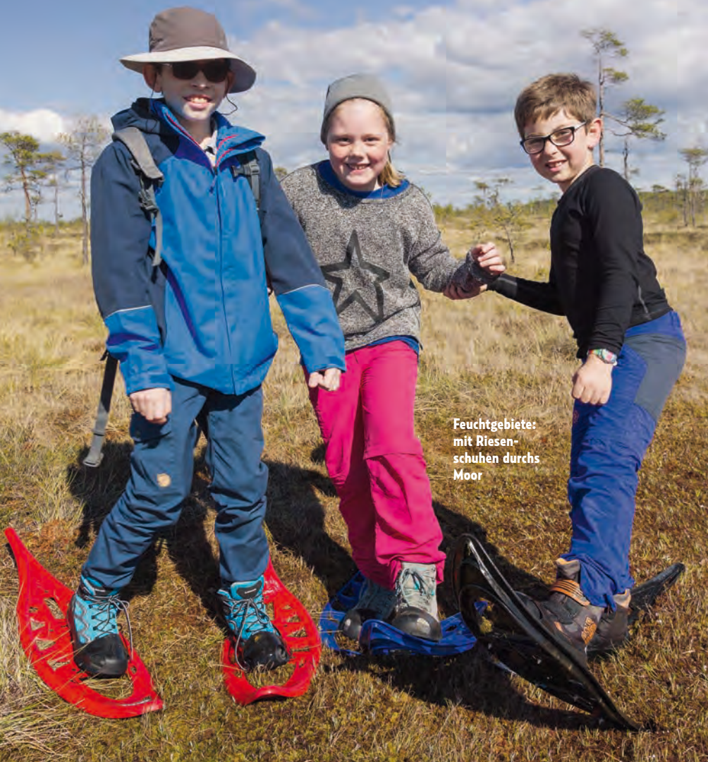
Feuchtgebiete: mit Riesen- schuhen durchs Moor